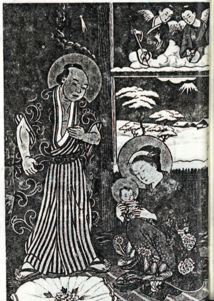
Ἡ Γέννησις τοῦ Σωτῆρος (ἑπινοκὴ τῆς ἑπινοκῆς τοῦ ἁγιογράφου ποῦ Παναγιώτου).