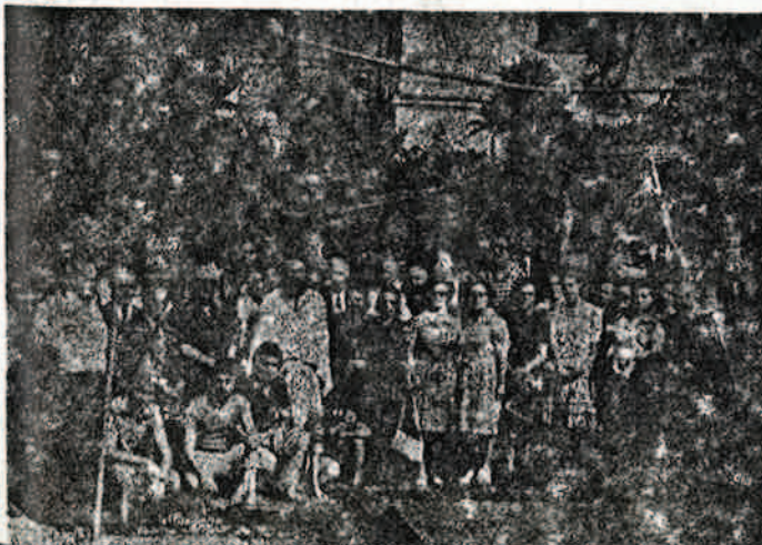
Από τη λειτουργία της Αγ. Μαρίνης μετά την απόλυση.

Βαρύτιμο διακοπτήριο, 2 φαναράκια, 2 θυμιατά, σταυ-