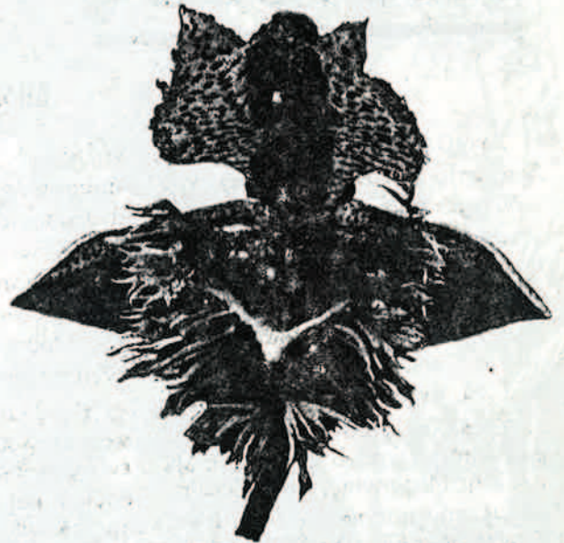
Ὁμοίως εἰρηκὸ ἄνθος πρὸς φῶτισην στὸν κῆμο τοῦ Ἁγίου Ἀνδρέου

Σήμερα στὸν 20ον αἰῶνα, τὸν αἰῶνα τῶν φῶτων, ὅπως τὸν εἶπαν, πού τὰ ἔθνη συναγωνίζονται ποῖο νὰ παρουσιάσῃ περισσότερα φῶτα, πολιτισμόν, μηχανές, ἐφευρέσεις, πρόδοον,