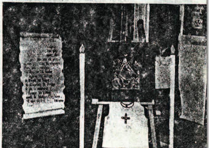
Μία γωνιά από την αίθουσα του «Πρωτοκλήτου» με την άμορφη διακόσμηση. Βλέπουμε και ένα καλορραμένο χιτώνα βαπτίσεως.