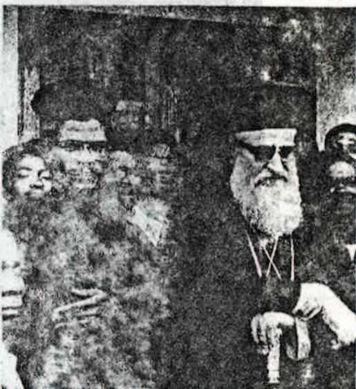
Ὁ Σεβασμιότατος Μητροπολίτης Κεντρικῆς Ἀφρικῆς κ. Νικόδημος καὶ ὁ διάκονος τῆς Ἐκκλησίας τῆς Κανόνγκα Νικόδημος, στὰ προστάσια τοῦ Ναοῦ.

Ὁ Ἱεραποστολικὸς ἀγρὸς εἶναι ἀπέραντος καὶ ἐργασία πολλὴ καὶ κοπιώδης ἀνάμενει ἡμᾶς εἰς τὴν Ἀφρικὴν. Ἐφ' ὅσον διὰ τῆς χάριτος τοῦ Κυρίου ἐθέσαμεν τὴν χεῖρα ἐπὶ τὸ ἄροτρον, εἴμεθα ὑποχρεωμένοι καὶ ὀφείλομεν ὡς καλοὶ γεωργοὶ τοῦ ἀγροῦ τοῦ Κυρίου νὰ ρίψωμε τὸν σπόρον τοῦ Εὐαγγελικοῦ κηρύγματος εἰς τὰς ψυχὰς τῶν ἀγαθῶν Ἀφρικανῶν. Οἱ Ἀφρικανοὶ ἀποτελοῦσι δι' ἡμᾶς τὴν «ἀγαθὴν γῆν» διὰ τὴν ὁποῖαν ὠμίλησεν ὁ Κύριος. Διὰ τοῦτο ἔχομεν ἀνάγκην ἐργατῶν οἱ ὅποιοι νὰ ἐργάζωνται εἰς τὸν ἀγρὸν τοῦ Κυρίου ἐντατικῶς καὶ ἀδιαλείπτως καὶ μὲ πίστιν καὶ μὲ αὐταπάρνησιν εἰς τὸ ἔργον τὸ ὁποῖον ἐπιτελῶσι, μὲ ζῆλον καὶ ἀφοσίωσιν, προκειμένον νὰ κερδίσωμεν περισσότερους ὁπαδοὺς καὶ ἐπιτύχωμεν τὴν σωτηρίαν περισσότερων ψυχῶν.