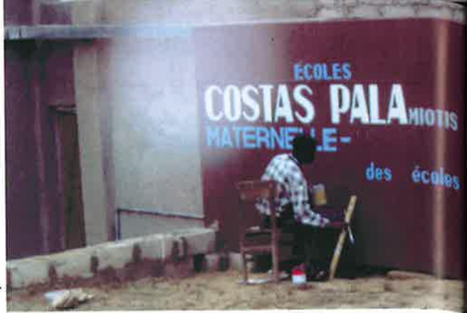
‘Ο σχεδιασμός τής έπιγραφής τών σχολείων «ΚΩΣΤΑΣ ΠΑΛΑΜΙΩΤΗΣ»